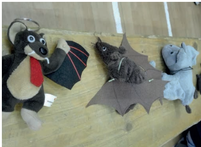
A hunyadis denevérek képviselői

Hamar eljött a reggel. Reggelizés, pakolás, takarítás után már az aulában ültünk. Átvettük a leadott mobiltelefonjainkat-amiről kiderült, hogy enélkül is jól éreztük magunkat, és az emléklapot, amit erről a hunyadis eseményről állítottak ki a tanárok. Az 55 hunyadis diák nevében köszönöm tanárainknak a szervezést, az előkészületeket, és kérjük, hogy jövőre is legyen denevér-derby!