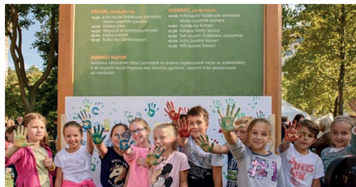
Hunyadi Mátyás Általános Iskola 4.b osztálya

Örülünk, hogy részesei lehettünk ennek a kezdeményezésnek, s mi is hozzájárultunk a Föld megóvásához. Reméljük jövőre is ott lehetünk!