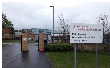
Jordanstown School bejárata